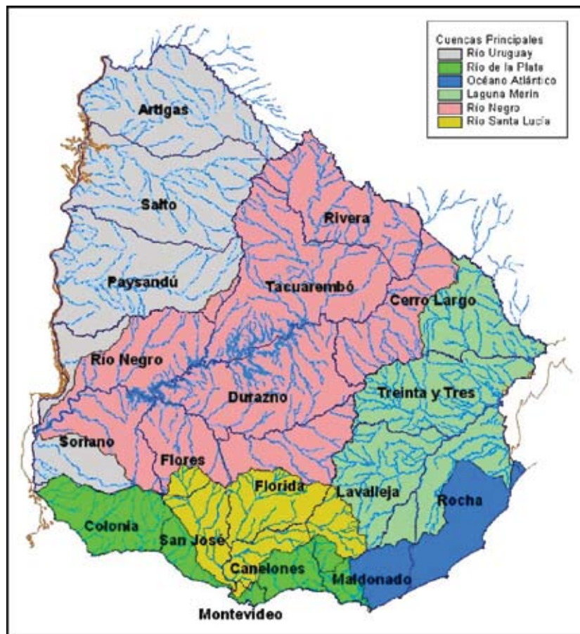
Figura 2. Hidrografía general del Uruguay, con las principales cuencas hidrográficas.

La República Oriental del Uruguay posee una superficie territorial de 176.215 km 2 , sin contar sus 125.000 km 2 de mar territorial (zona oceánica y Río de la Plata). El país presenta grandes planicies, una extensa red hidrográfica bien ramificada que se extiende e interconecta en seis cuencas hidrográficas (Figura 2), así como un importante número de embalses empleados principalmente en la generación de energía eléctrica, que ocupan una superficie total de 229.000 Ha.